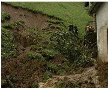
zemeljski plaz - posledice