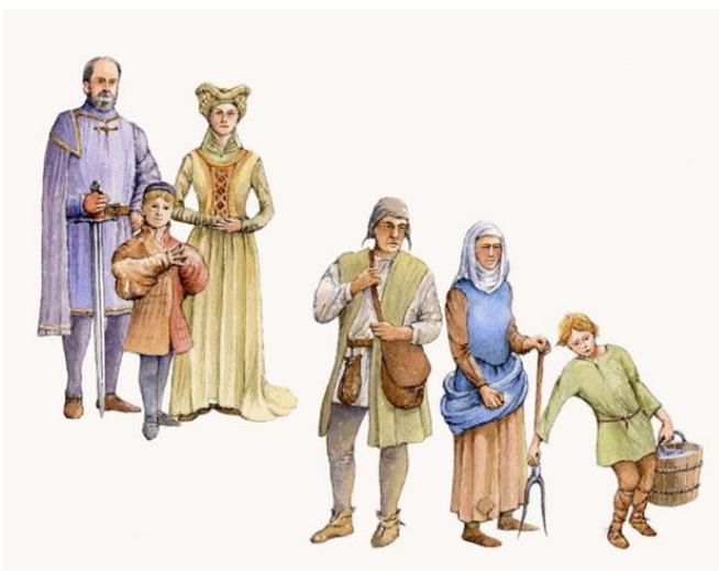
plemiška in kmečka družina