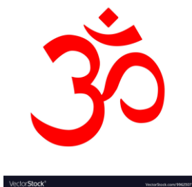
hinduizem – ohm