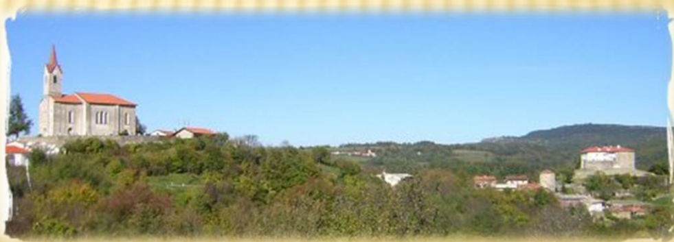
Prem pri Ilirski Bistrici