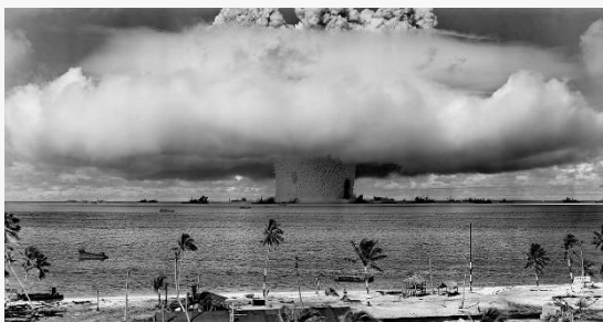
Jedrski poskusi v Pacifiku, Maršalovi otoki leta 1946

Oceanija je redkeje poseljena, zato so jo po drugi svetovni vojni velesile izkoriščale za jedrske poskuse . Oddaljenost od matične države pomeni večjo varnost velesil pred posledicami. Jedrske poskuse so opravljale ZDA, Velika Britanija in Francija. Največ jedrskih poskusov so opravili na Marshallovih (otok Bikini), Johnstonovih, Božičnih, Maldenovih otokih, Kiribatih, Francoski Polineziji (otok Mururoa) ter otokih Monte Bello. Radioaktivno sevanje pa je kljub oddaljenosti otokov pustilo grozljive posledice tako na otokih kot na prebivalcih sosednjih otokov.