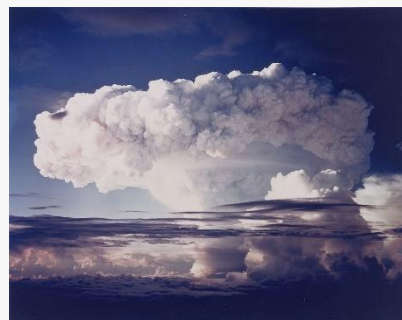
Poskusi v Pacifiku 1952

Otoki v Oceaniji se srečujejo s številnimi problemi!