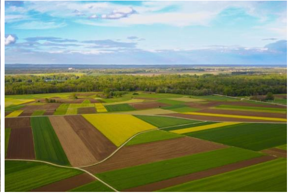
Ravnina in velika polja