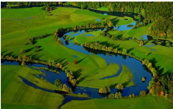
Reke delajo okljuke, poplavljajo